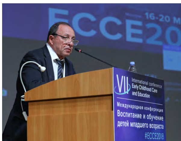
Выступление на конференции ЕССЕ