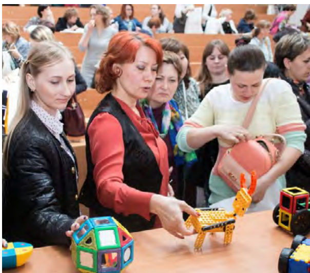
Мастер-классы для педагогов, май 2018 г.

проблемой? Не всем понятно, как относиться к цифровому миру. С одной стороны, мы понимаем, что движение прогресса связано с развитием «цифры», и важно, чтобы ребёнок осваивал новые технологии. Но при этом знаем, что гаджеты не очень полезны для ребёнка. При всём при этом «цифра» позволяет раскрыть перед ребёнком такие глубокие и сложные темы, которые раньше были недоступны детям, даже помыслить об этом было невозможно. Оказывается, в цифровом исполнении они становятся простыми. Многих это пугает, потому что дети быстро начинают осваивать слишком сложное содержание лучше взрослых. Формировать образовательный процесс в век цифровых технологий — это тоже одна из задач МПАДО.