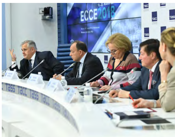
Пресс-конференция в ТАСС, май 2018 г.