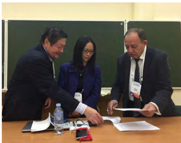
Подписание соглашения о сотрудничестве между МПАДО и кафедрой ЮНЕСКО по изучению глобальных проблем

— Сейчас мы планируем масштабное исследование кросс-культурной модели. Оно коснётся влияния цифровизации на развитие ребёнка-дошкольника. Почему это является